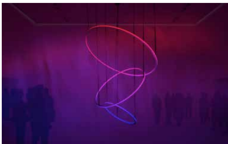
Photo de l'installation : Ming, esquisses, par Moritz Waldemeyer