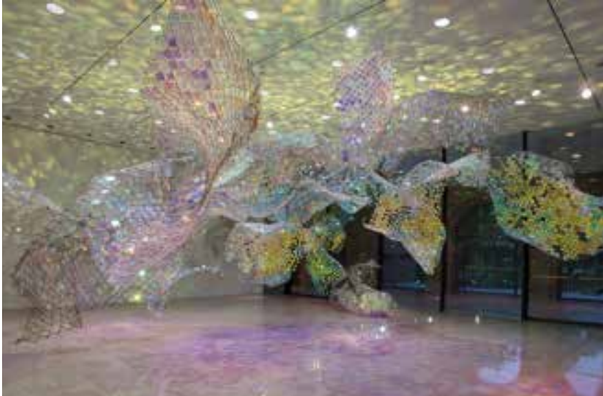
Unwoven Light at Rice Gallery © Soo Sunny Park

Dans cette nouvelle création, l'installation tissée d'une clôture en mailles et sertie de diamants en plexiglas dichroïque, déconstruit la lumière qui l'éclaire. Des ombres violettes et des reflets jaunes-verts restructurent l'espace qu'ils occupent. L'œuvre affranchit ici la lumière qui n'est plus seulement le révélateur des éléments de la sculpture, elle est sculpture en elle-même.