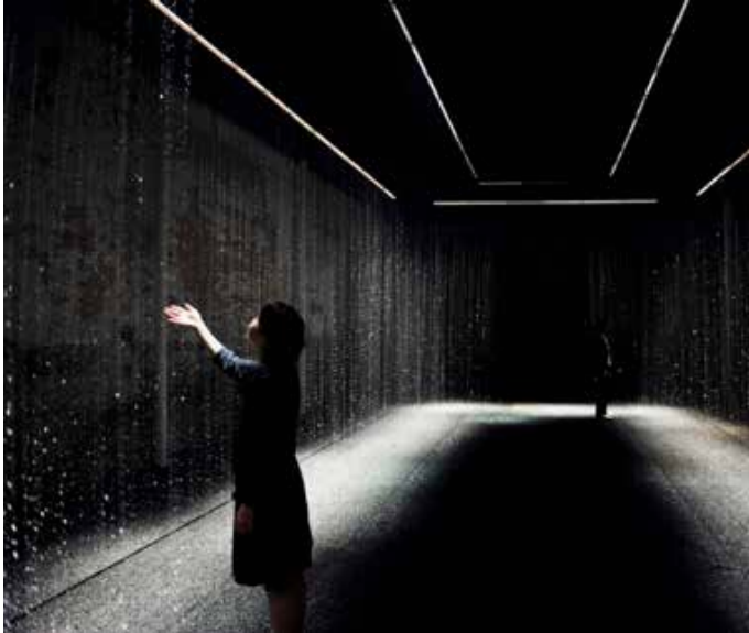
Luce Tempo Luogo par DGT, 2011