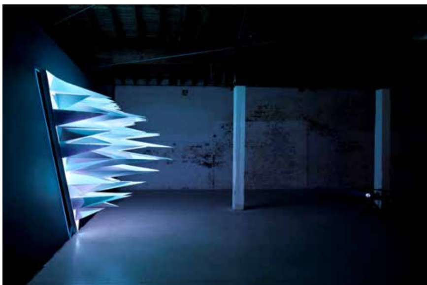
Flynn Talbot / Primary

Installation : Unwoven Light at Rice Gallery © Soo Sunny Park