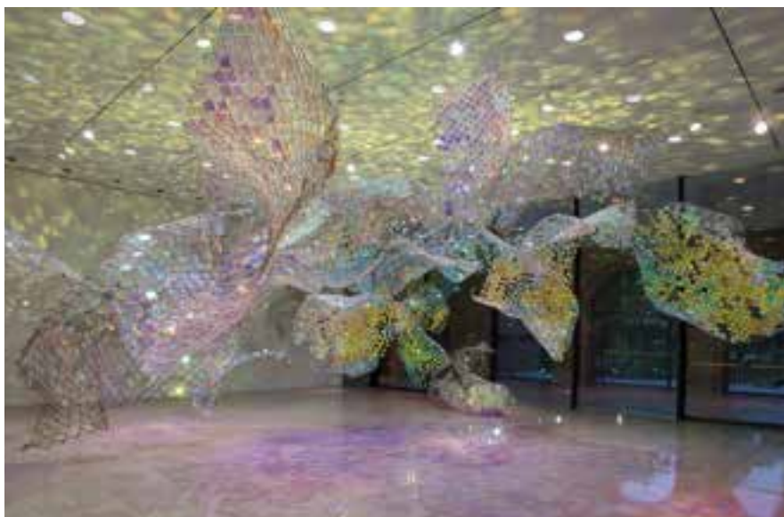
Soo Sunny Park / Unwoven Light (section of)

Installation : Unwoven Light at Rice Gallery © Soo Sunny Park