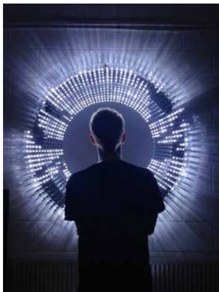
© Alex Asseily et Goodwin Hartshorn en collaboration avec Haberdashery